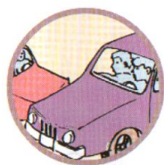
СТОЛКНОВЕНИЕ ТРАНСПОРТНЫХ СРЕДСТВ