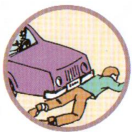
НАЕЗД НА ПЕШЕХОДА