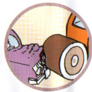
НАЕЗД НА СТОЯЩЕЕ ТРАНСПОРТНОЕ СРЕДСТВО